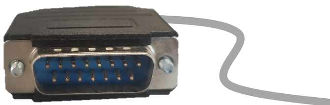
Conector DB15 pines para Progetti