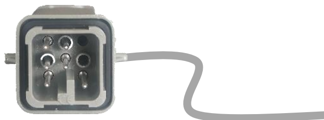
Conector 8 pines para EP-ELI-02